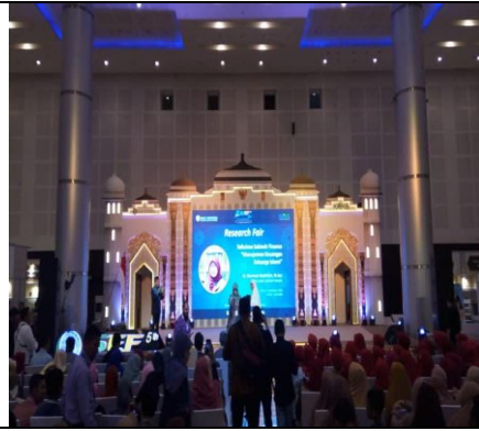
ISEF 2018, Surabaya