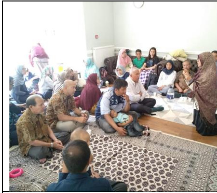
Oxford, UK, 2018